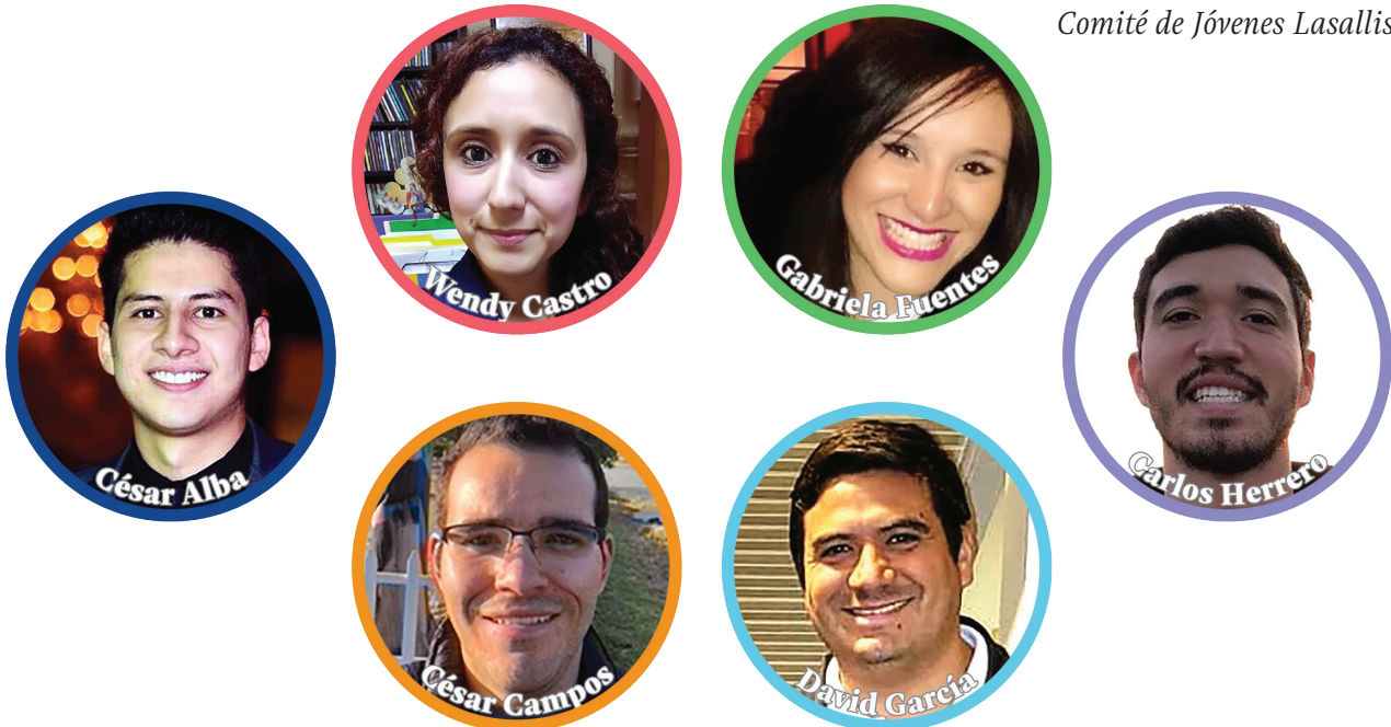
Comité de Jóvenes Lasallistas.

El COVID-19 ha traído consigo enormes retos para continuar el trabajo del Movimiento y a pesar de la imposibilidad de estar reunidos de modo presencial se han logrado encuentros más allá de las paredes de las escuelas, entrando el dinamismo lasallista a los hogares, a las familias. Nuestro gran desafío sigue siendo formar comunidades responsables y protagonistas de la Misión de Jesús, vinculadas entre sí y que, a pesar de todo, permanezcan unidas.