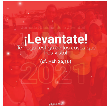
JMJ 21- XXXVI Jornada Mundial de la Juventud, 2021