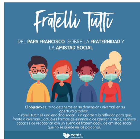
FT- Encíclica Fratelli-Tutti

Las siguientes propuestas deberán ser adaptadas por cada grupo de acuerdo a la edad y al contexto.