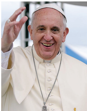
IMP- Intenciones mensuales del Papa